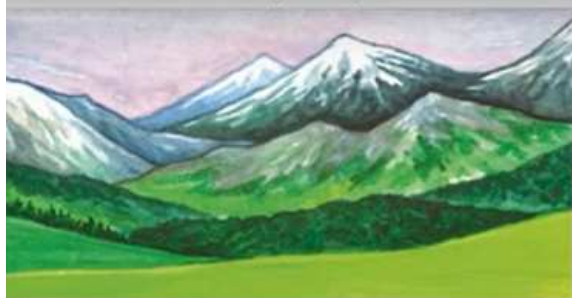
Piosenka - Polskie krajobrazy